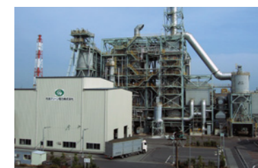
バイオマス発電プラント