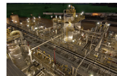
合成樹脂製造プラント

2014年度中期経営計画の重点地域の一つであるベトナムにおいて、2014年度は新規案件を1件受注しました。さらに延伸していたプロジェクトも動き出す見通しで、今回の受注を成功裏に遂行し、実績を積み重ねることで同地域でのプレゼンスを高めていきます。