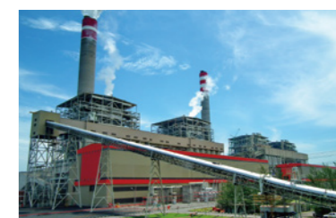
インドネシア「タンジュン・ジャティB」石炭火力発電所