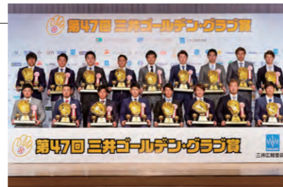
第47回三井ゴールデン・グラブ賞 受賞選手

当社グループは、三井グループ24社で構成される三井広報委員会の会員会社として様々な社会貢献活動を支援しています。三井広報委員会は、「人の三井」という、三井グループの特色をベースに「人を大切にし、多様な個性と価値を尊重することで社会を豊かにする」ことを目的に、文化・芸術活動を行っています。