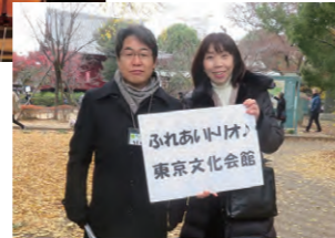
コンサート会場までの案内係などのボランティアスタッフとして参加