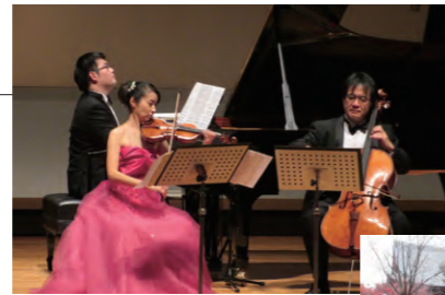
2018年12月16日 「ふれあいトリオ」東京公演

クラシック音楽に触れる機会の少ない子どもたちや障がいを持つ方々に、生のクラシック音楽に触れてもらい心豊かな生活を送ってほしいとの願いから、2003年に「ふれあいトリオ」として活動をスタート。2019年からは「ふれあいコンサート」として活動をさらに広げています。当社グループは、活動スタート時から協賛だけではなくコンサート会場での案内係などのボランティア活動も行っています。