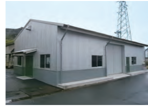
三井E&S玉野事業場に新設した実習棟