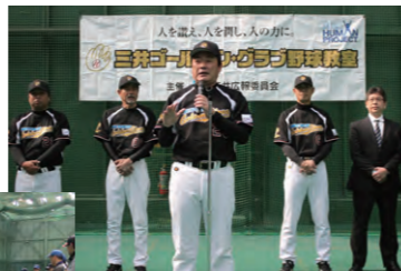
ゴールデン・グラブ野球教室の 様子