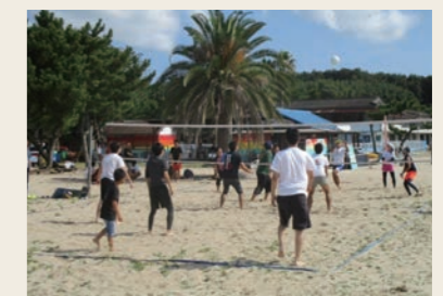
大分事業場 2019オータムフェスタ