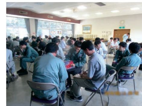
解決志向型コミュニケーション研修

事業場外資源(外部委託)によるEAPサービス(従業員支援プログラム)を三井E&Sグループ各社の従業員(約9,000人)とその家族が利用できるよう、三井E&Sホールディングスにて一括契約しています。このサービスは、電話・Web・FAX・面談にて健康・メンタル・法律相談をプライバシーが厳守されたうえで24時間受け付けるもので、10年以上継続している従業員支援策です。