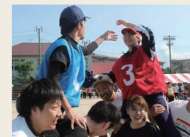
玉野事業場 2019三井E&S運動会