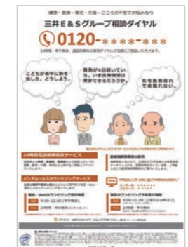
三井E&Sグループ相談ダイヤル