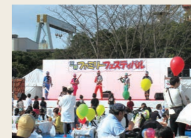
千葉事業場 2019三井E&Sファミリーフェスティバル

各事業場において、職場の活性化と親睦を目的とした労使共催職場対抗ソフトボール大会、事業場運動会、ファミリーフェスティバル等を開催しています。